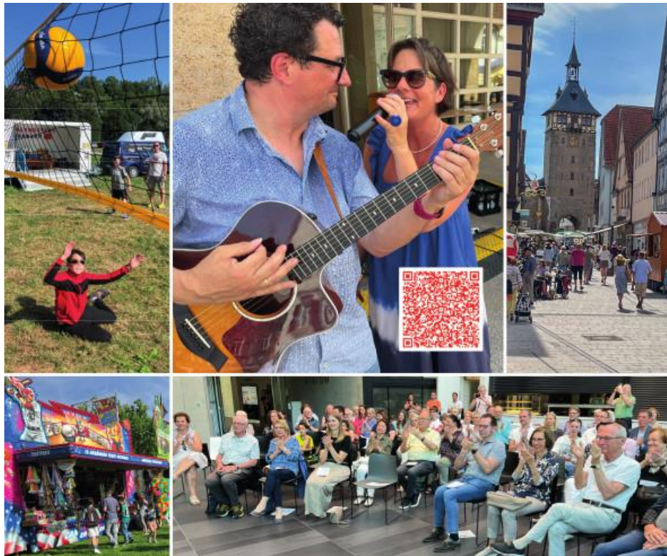
Collage: Lorenz Obleser

Den Veranstaltungskalender finden Sie auch unter